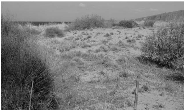
Σχήμα 3. Παράκτιες θίνες σταθεροποιημένες από την ανάπτυξη φυτών.