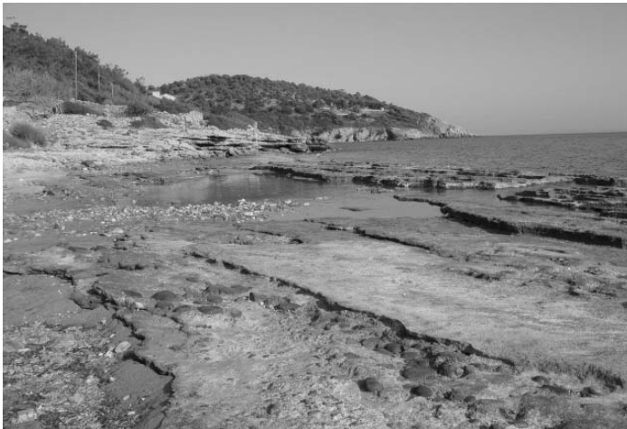
Σχήμα 1. Beach rocks στην ακτή Άγιος Ισίδωρος.

Εξετάστηκαν όλες οι ακτές της Λέσβου για την παρουσία beach rocks και διαπιστώθηκαν μόνο σε ένα μικρό μέρος των ακτών (Σχ.1 ) είτε υποθαλάσσια είτε υπεράνω της σημερινής στάθμης της θάλασσας. Συγκεκριμένα διαπιστώθηκαν στο νότιο τμήμα σε αρκετές θέσεις από την παραλία Βατερών στα δυτικά, έως τον όρμο Τσίλια, ανατολικά, καθώς και στις ανατολικές ακτές στην παραλία Σκάλα Κυδωνίων και Μυστεγνών (Σχ. 6). Όλες οι εμφανίσεις συνδέονται με προαλπικά πετρώματα που περιλαμβάνουν ενστρώσεις μαρμάρων και γενικά ανθρακικών πετρωμάτων, ενώ απουσιάζουν εντελώς από όλες τις υπόλοιπες ακτές της Λέσβου που αποτελούνται από ηφαιστειακά πετρώματα, καθώς και από τους δυο κόλπους Καλλονής και Γέρας.