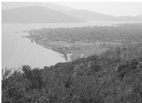
Σχήμα 7. Αλλουβιακή πεδιάδα.

α) Τεκτονικής προέλευσης ακτές. Παρά το γεγονός ότι στη Λέσβο υπάρχουν πολλά ρήγματα, οι ρηξιγενείς ακτές είναι λίγες, είτε γιατί τα περισσότερα ρήγματα είναι κάθετα προς τις ακτές είτε γιατί οι τεκτονικοί κρημοί σε ηφαιστειακά πετρώματα μεταπίπτουν γρήγορα σε διαβρωσιγενείς κρημούς από τη δράση των κυμάτων (δευτερογενείς ακτές).