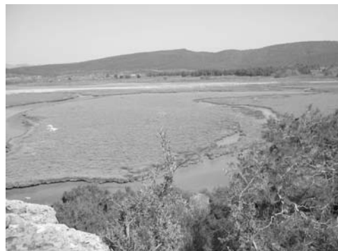
Σχήμα 8. Έλη με πολύριζα φυτά που διασχίζονται από διάσπαρτες κοίτες