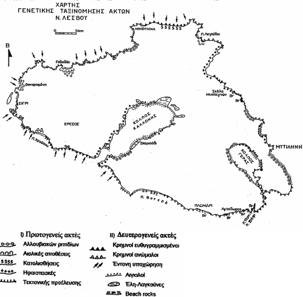
Σχήμα 6. Χάρτης γενετικής ταξινόμησης των ακτών της Λέσβου

1) Ακτές αλλουβιακών πεδιάδων και ριπιδίων. Πρόκειται για σχετικά ευθύγραμμες ακτές που διαρρέονται από πολλά ρεύματα που προέρχονται από τα κοντινά βουνά. Αναπτύσσονται κυρίως στους κλειστούς κόλπους Καλλονής και Γέρας, όπως επίσης στις παραθαλάσσιες πεδιάδες στην περιοχή Σίγρι και νότια της πόλης της Μυτιλήνης. Στον κόλπο Καλλονής, όπου απαντώνται οι