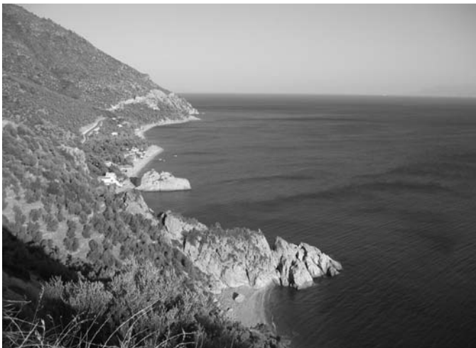
Σχήμα 5. Ακτή που βυθίζεται με μεγάλη κλίση στη θάλασσα χωρίς κρημούς με μικρούς αιγιαλούς.

Β Οι ακτές που βυθίζονται στη θάλασσα με κλίσεις που ποικίλουν από λίγες μοίρες έως και 40^{\circ} - 60^{\circ} χωρίς κρημούς (Σχ.5 ). Η κλίση τους παραμένει η ίδια πάνω και κάτω από τη στάθμη της θάλασσας. Οι ακτές αυτές, κατά κύριο λόγο, δομούνται από ηφαιστειακά πετρώματα. Οι ακτές αυτές δεν αποτελούν ενεργά υποχωρούσες ακτές.